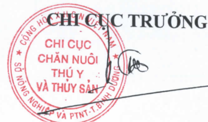
Trần Phú Cường